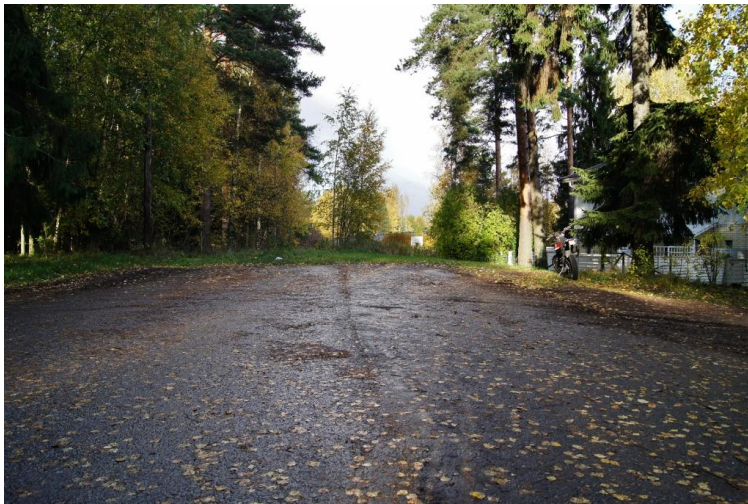
Kuva 3. Vanha valtatieen pääty.

Autojen kääntämisen aiheuttamat ongelmat voisi ratkaista esim. tekemällä Vanha valtatieen päähän oikean kääntöpaikan nykyisen tienpätkän sijaan. Nykyisin tuota tien päätä ja tien vierustoja käyttävät Vanha valtatieen toisella puolella olevien rivitalojen asukkaat parkkipaikkanaan (kuva 3.). Vanha valtatieen ajonopeuksia koulun kohdalla puolestaan voisi hillitä korotetulla suojatiellä.