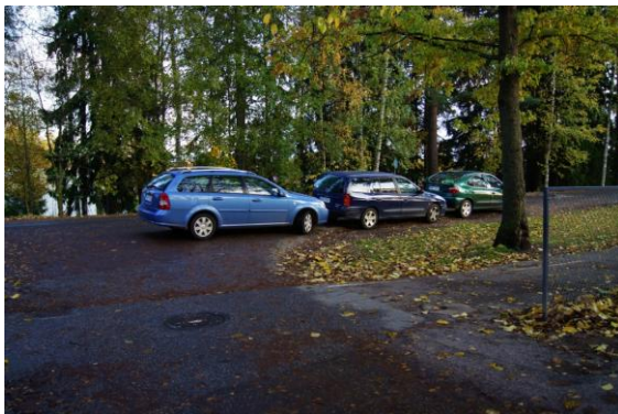
Kuva 4. Vanhan valtatieen varteen pysäköidyt autot.

Vanha valtatie on koulun kohdalta hyvin katkonainen lukuisine liittymineen ja liikenne on sumppuista tien päättymisen vuoksi. Tien varteen pysäköidyt autot tekevät liikenteestä entistä haastavampaa (kuva 4.)