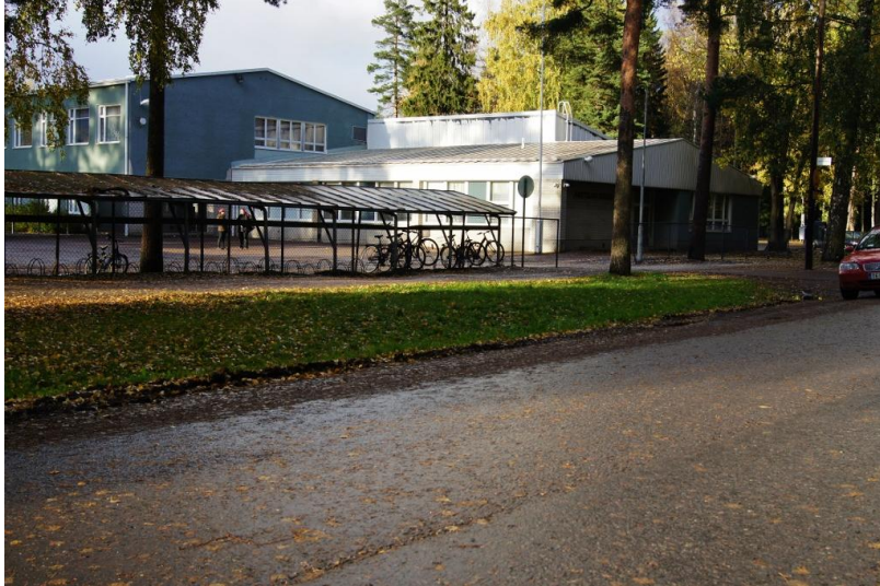
Kuva 5. Vanhan valtatie ja pyörätien välinen viheralue.

Liikenneturvallisuutta voisi esimerkiksi parantaa tekemällä autoille Vanha valtatie ja pyörätien väliselle leveälle viherkaistaleelle (kuva 5.) lyhytaikaiseen pysäköintiin tarkoitettuja parkkipaikkoja ja rajoittamalla niiden käyttöä pysäköintikiekolla (vinoparkki tai suorat ruudut). Muualla Vanha valtatie varrella voisi kokonaan kieltää pysäköimisen/pysähtymisen.